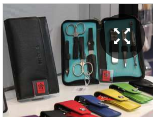
Pfeilring präsentiert bunte Etuis für Maniküresets.

Die Ambiente in Frankfurt läuft zufriedenstellend. So lautet der einhellige Tenor, der rund 30 Solinger Aussteller auf der internationalen Leitmesse der Konsumgüterindustrie. Trotz des Karnevals und des guten Wetters am Wochenende seien viele Besucher auf das Messegelände gekommen, um sich unter anderem Schneidwaren und Bestecke von Solinger Unternehmen anzuschauen.